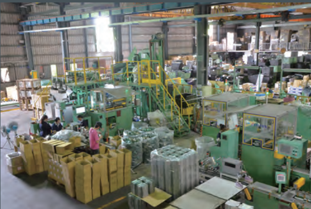
長益公司斥資3千萬，於今年完成增建並啟用的全自動化包裝廠