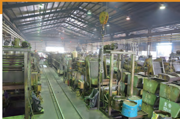
▽ 熱處理廠 4條產線全啟

為了掌握產品品質，華盛更於1995年導入熱處理設備，並將它經營成一座每個月可以乘載2,500噸螺絲扣件製品的熱處理廠，並對外提供熱處理服務。從製造到出貨，用熱處理確保品質關鍵，透過自我包裝廠嚴管品質，為客戶提供最高標準的信心產品！