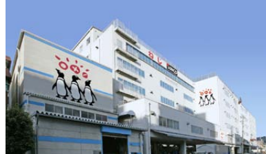
Distribution center 物流センター

Although SUNCO Industries mainly sources from Japan, it also purchases from overseas countries such as Taiwan and China. In recent years it has been working on quality management and solving various issues, and it is looking for overseas manufacturers with high quality awareness. Its sales offices are in Japan only and the products are delivered across Japan from Osaka. “Currently our customers deliver our products to overseas customers. We are thinking to roll out an export service by acting as an export agent for them to save their time.”